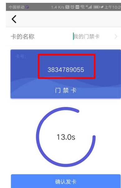
5、出现卡号点确认发卡